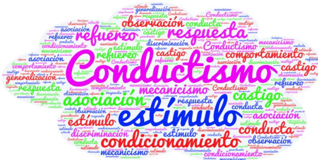
Figura Nro. 2 WordArt

Nota. La figura, muestra la respuesta de los grupos de enfoque, sobre la apreciación del conductismo.